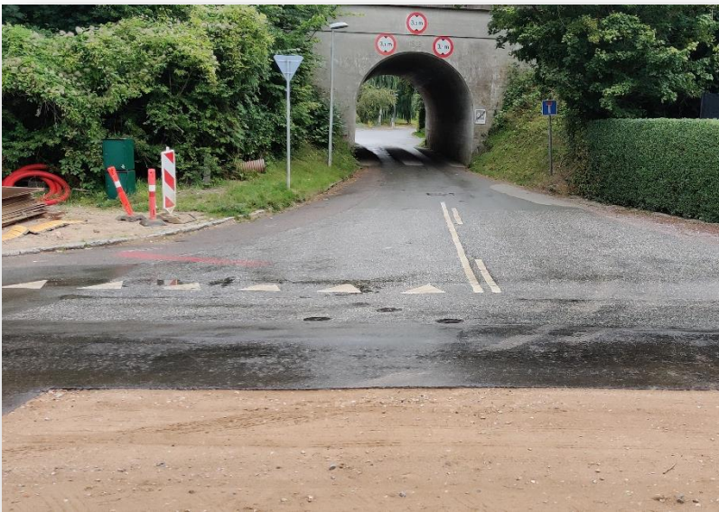
Strandvejen ved 3. tunnel - færdiggøres inden bestyrelsesmødet

Fredag den 11. september 2020 kl. 8.00 - 10.00