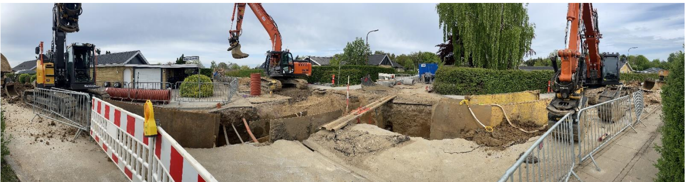
Separering af kloakker ved Aagaard/Gravens

Fredag den 19. august 2022 kl. 8.00 - 10.00