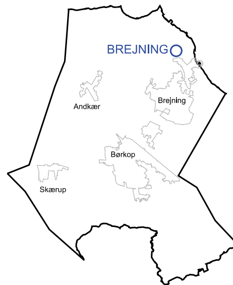
Kloakopland for Brejning Renseanlæg

Der arbejdes fremadrettet på at separere spildevand og regnvand, og i dag er ca. 2/3 af Vejle Kommunes kloaknet separeret, således at rensningsanlæggets kapacitet til at rense vand koncentrerer om det forurenede spildevand.