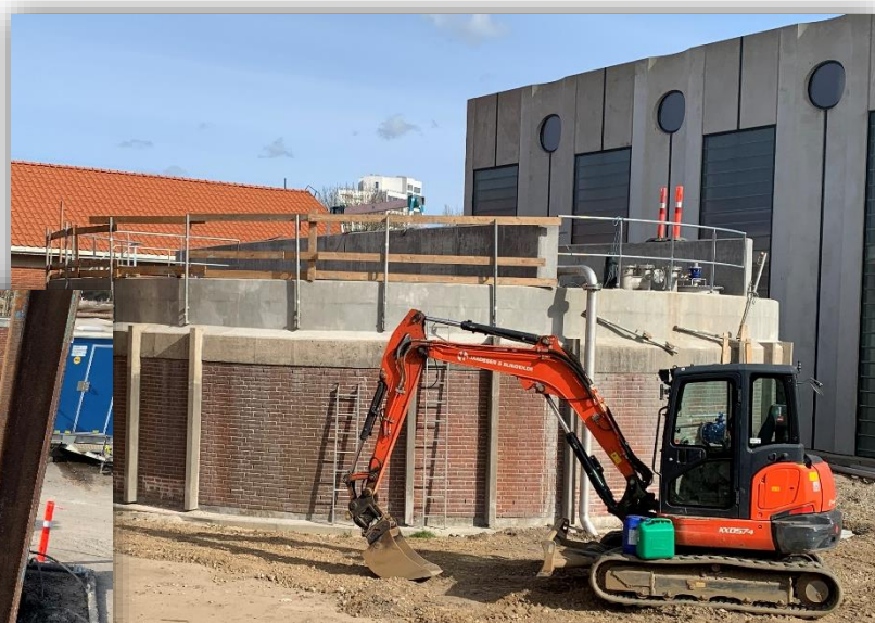
Færdigt låg på slamlagertank