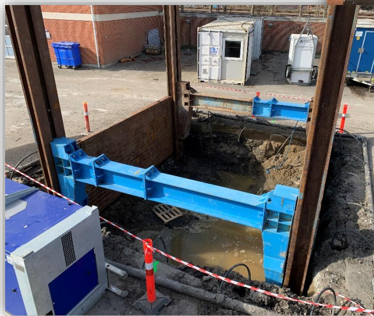
Etablering af boregrube til spildevandskorridor mod vest under baneterrænet

Tirsdag den 26. april 2022 kl. 8.30 - 11.00 på Give Renseanlæg