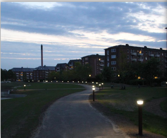
Aftenstemning i Østbyparken

Tirsdag den 9. juni 2020 kl. 8.30 - 10.30