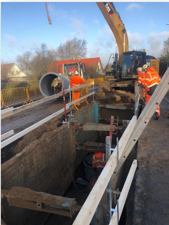
Separatkloakering i Ågård

Tirsdag den 14. juni 2022 kl. 8.30 - 10.45