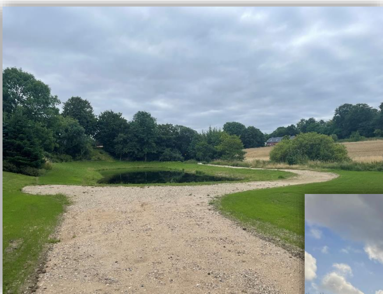
Bassiner i Aagaard

Tirsdag den 7. februar 2023 kl. 8.30 - 10.30