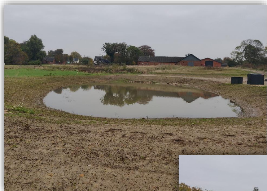
Regnvandsbassiner i Assendrup

Tirsdag den 23. november 2021 kl. 8.30 - 10.30